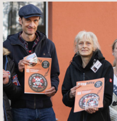
Gisa bei einer Presseaktion zusammen mit Breiti von den Toten Hosen.

(ff). In den vergangenen Monaten durfte sich fiftyfifty wieder über zahlreiche, Sach- und Geldspenden freuen. Jede einzelne Spende trägt dazu bei, die Arbeit aufrecht zu erhalten. Vielen herzlichen Dank dafür! Der Platz im Heft reicht leider nicht, um alle namentlich zu nennen, an dieser Stelle möchten wir uns stellvertretend bei Henry Schein Dental, bei der Düsseldorfer Bürgerstiftung, Mr.Düsseldorf, Fressnapf Hilden, VIR-Group Fahrschulen und bei der Van Meeteren Stiftung bedanken.