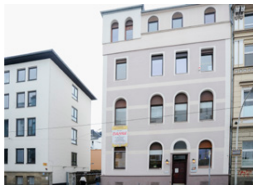
Das VFG-Betreuungszentrum in der Quantiusstraße 2 und 2a. Im Gebäudekomplex gibt es unter anderem Beratungsbüros, Medikamente (z.B. Substitution), psychosoziale Betreuung und spezielle Angebote für MigrantInnen.