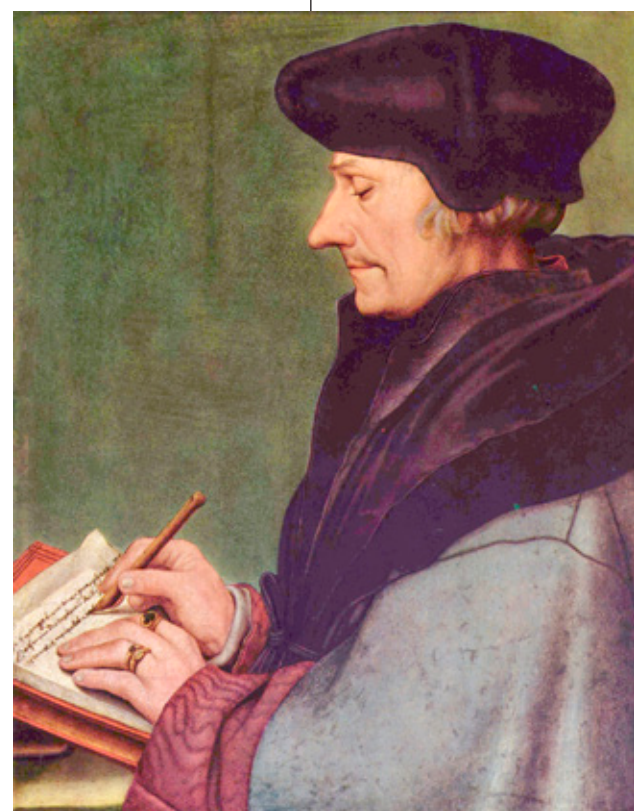
Hans Holbein d. J.: Porträt des Erasmus von Rotterdam, 1523

In unserer nächsten Ausgabe: Immanuel Kant