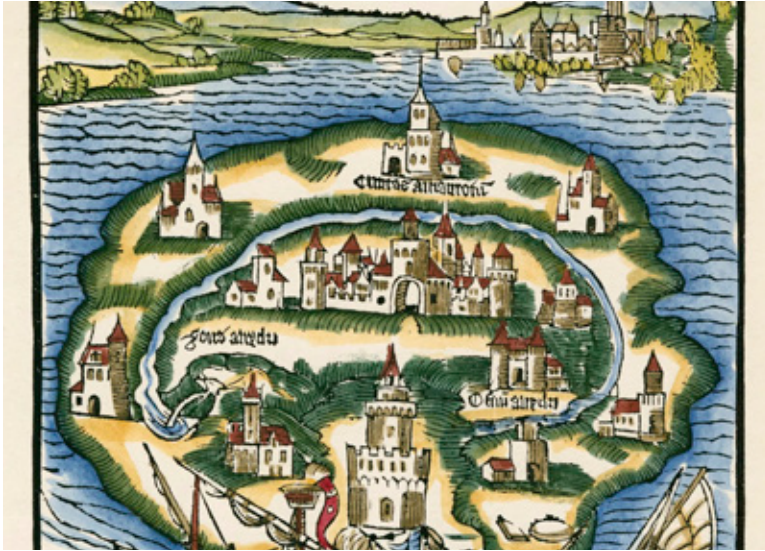
Karte der Insel Utopia. Nachträglich kolorierter Holzschnitt aus der „Utopia“-Ausgabe von 1518 (Ausschnitt)