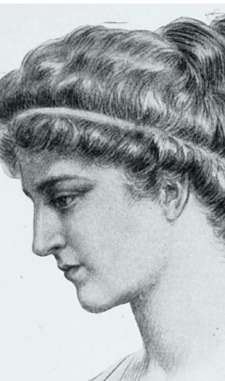
Hypatia (*um 355, † 415 / 416), imaginäres Portrait von Jules Maurice Gaspard (1908).

„Bewahre dein Recht zu denken, denn auch falsch denken ist besser als gar nicht zu denken.“