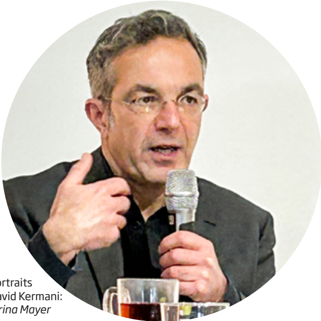
Alle Portraits von Navid Kermani