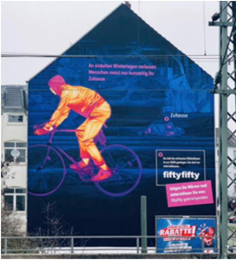
Ein großformatiges Motiv der Kampagne in Düsseldorf Flingern.