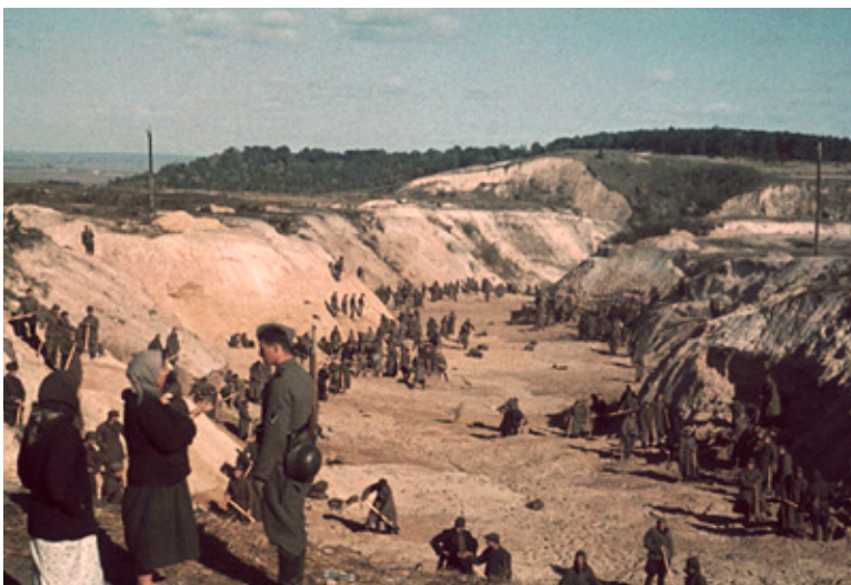
Nach dem Massaker mussten sowjetische Gefangene der Wehrmacht das Massengrab zuschütten.

Benrather Str. 32a, 40721 Hilden, Tel. 02103-5903, wilhelm-fabry-museum.de; bis 14. 5.